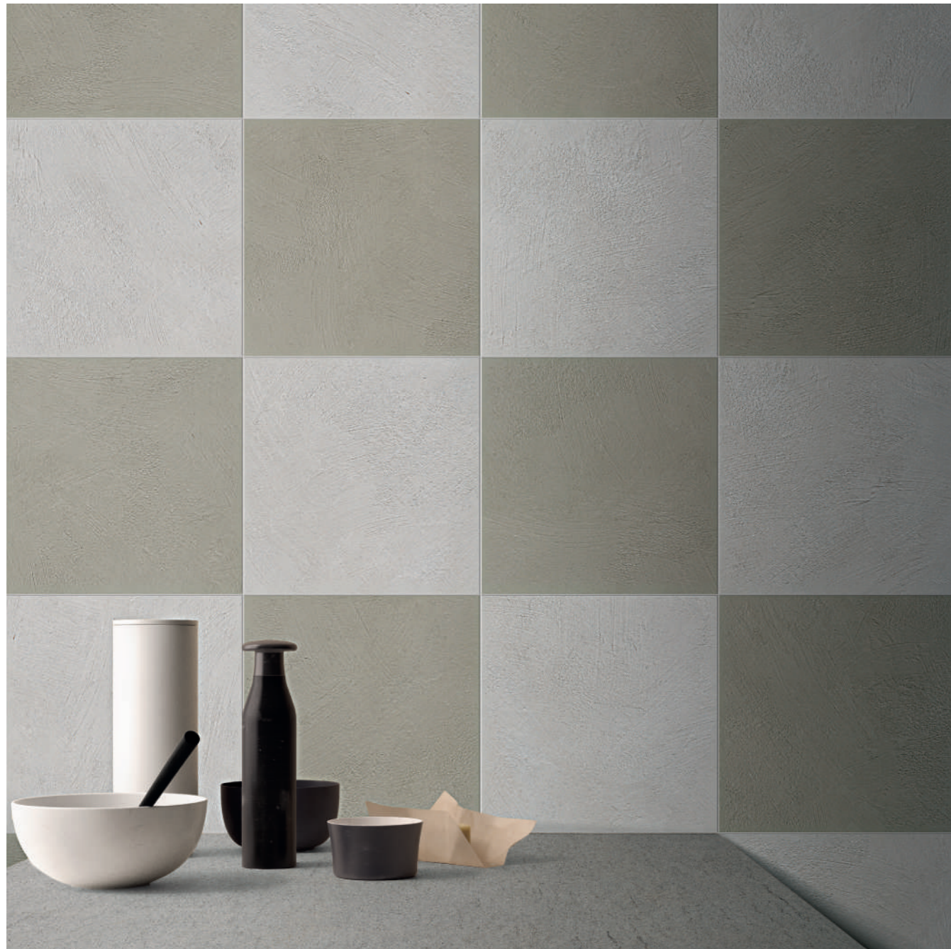
wall: ALTEREGO ASH 30x30 - MUD 30x30