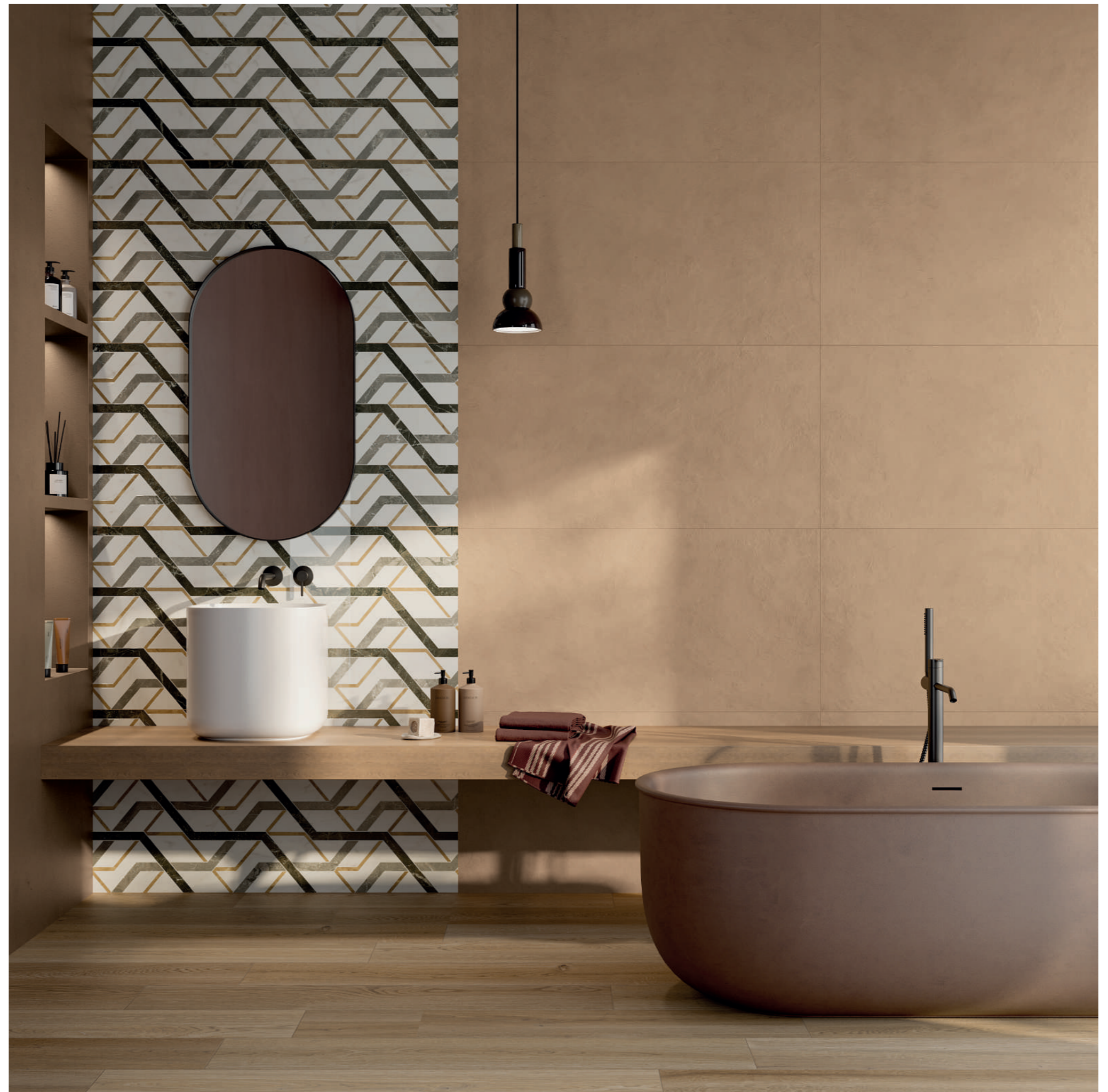
wall: ALTEREGO MOU 60x120 - SENSI FANTASY SPIDER LUX3D 60x120