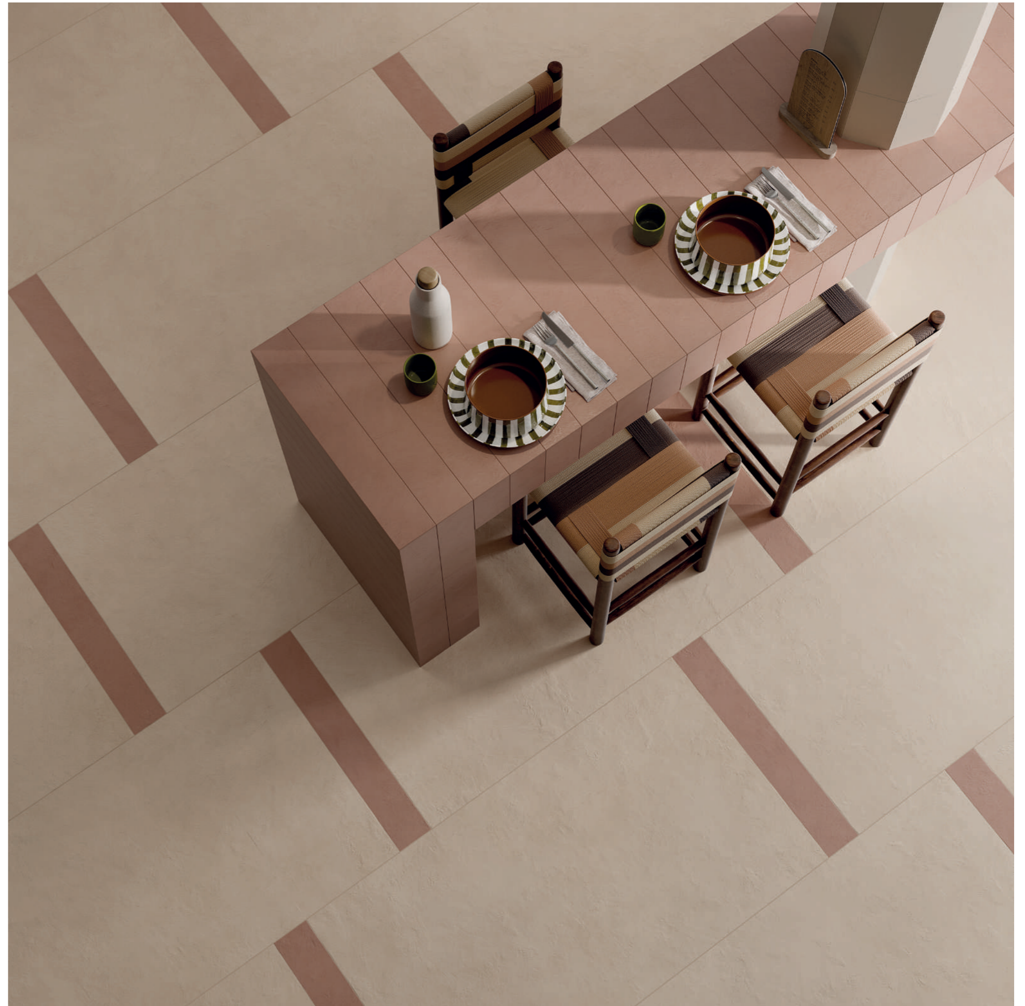
floor: ALTEREGO CREAM 60x120 - COTTO 10x60