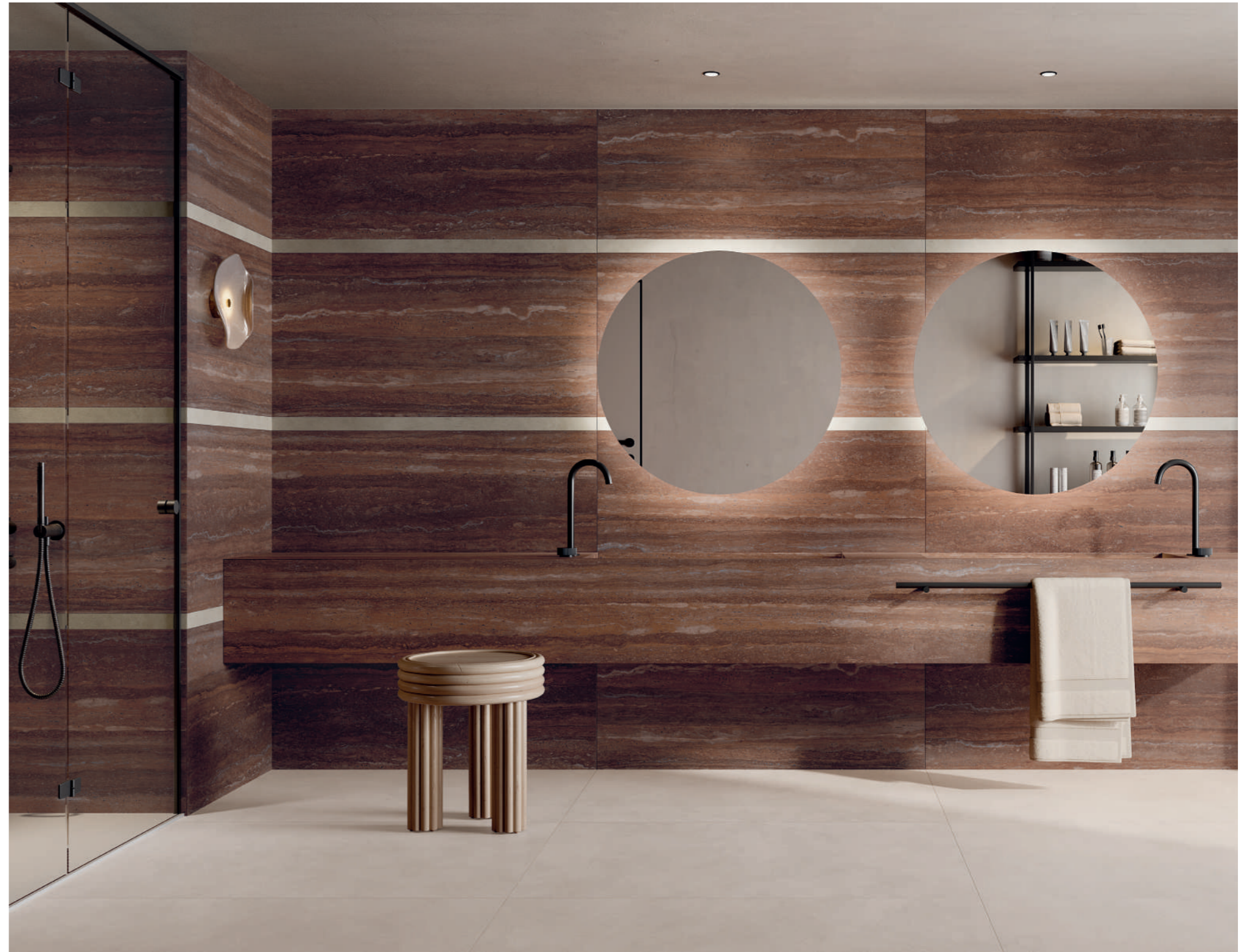
washbasin top: SENSI ROMA RED 120x280