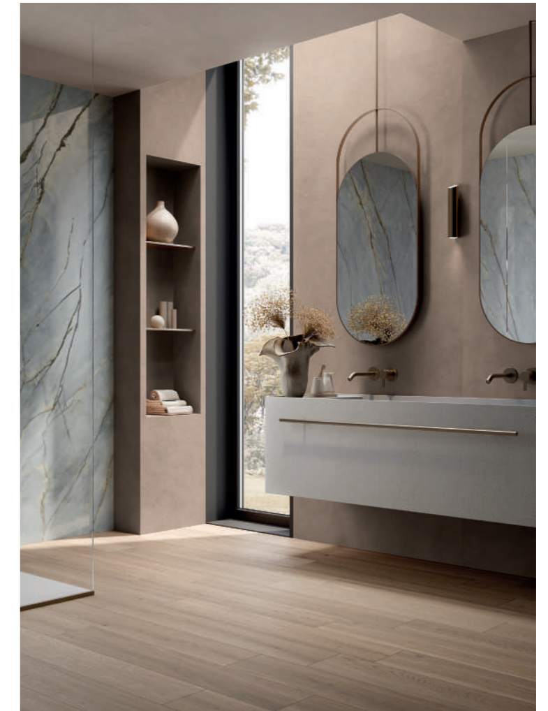
RESIN + WOOD