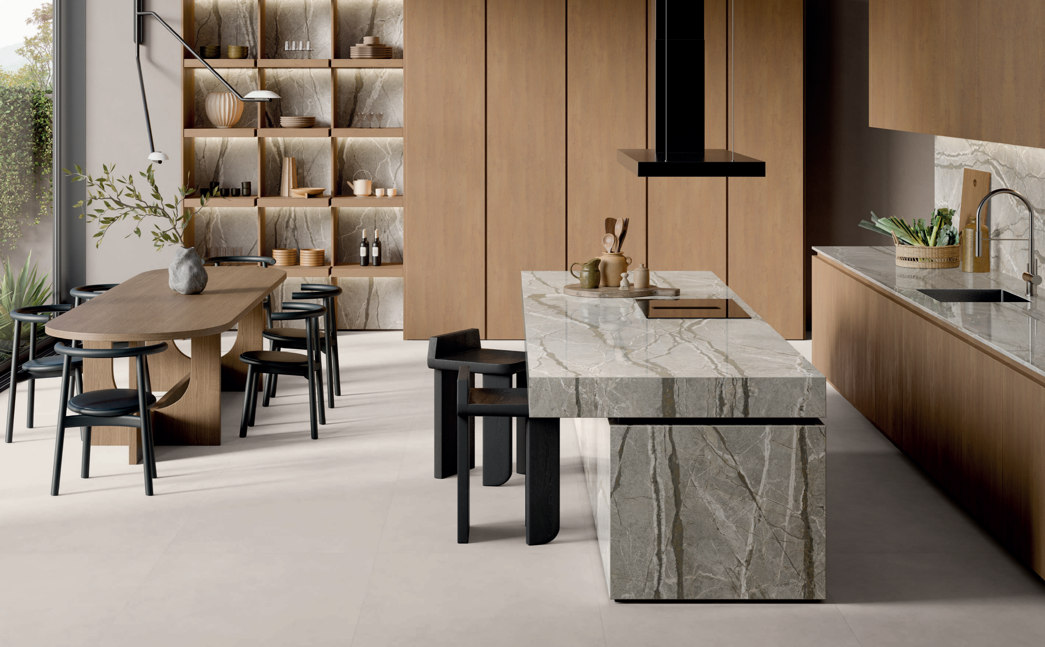
backsplash and top: ABKSTONE SILVER ROOTS FULLVEIN3D LUX3D 20mm