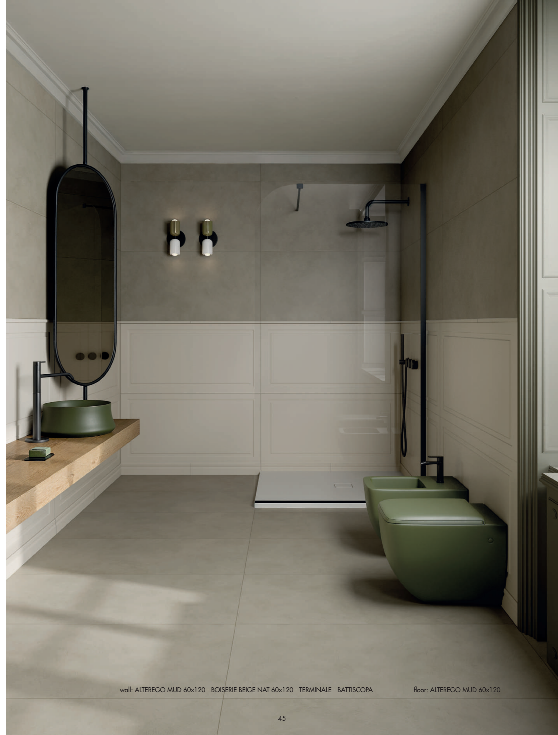
wall: ALTEREGO MUD 60x120 - BOISERIE BEIGE NAT 60x120 - TERMINALE - BATTISCOPIA floor: ALTEREGO MUD 60x120