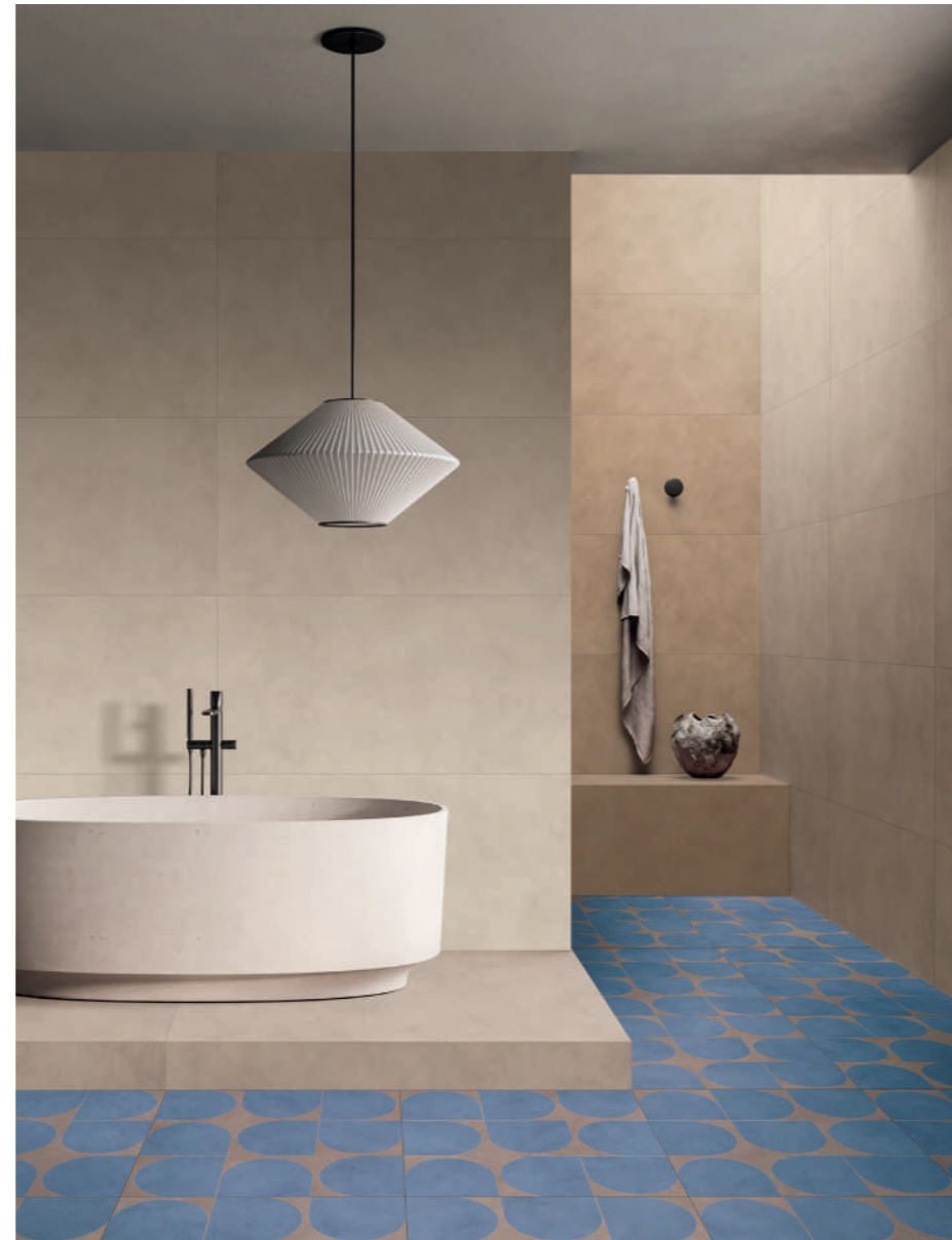
RESIN + PATTERN

The many inspirations behind the ABK range can be used to customise any space and create constantly changing material effects. Resin, stone, marble, wood and pattern are skilfully combined to create a surprising crossover style ideal for highly contemporary architectural solutions.