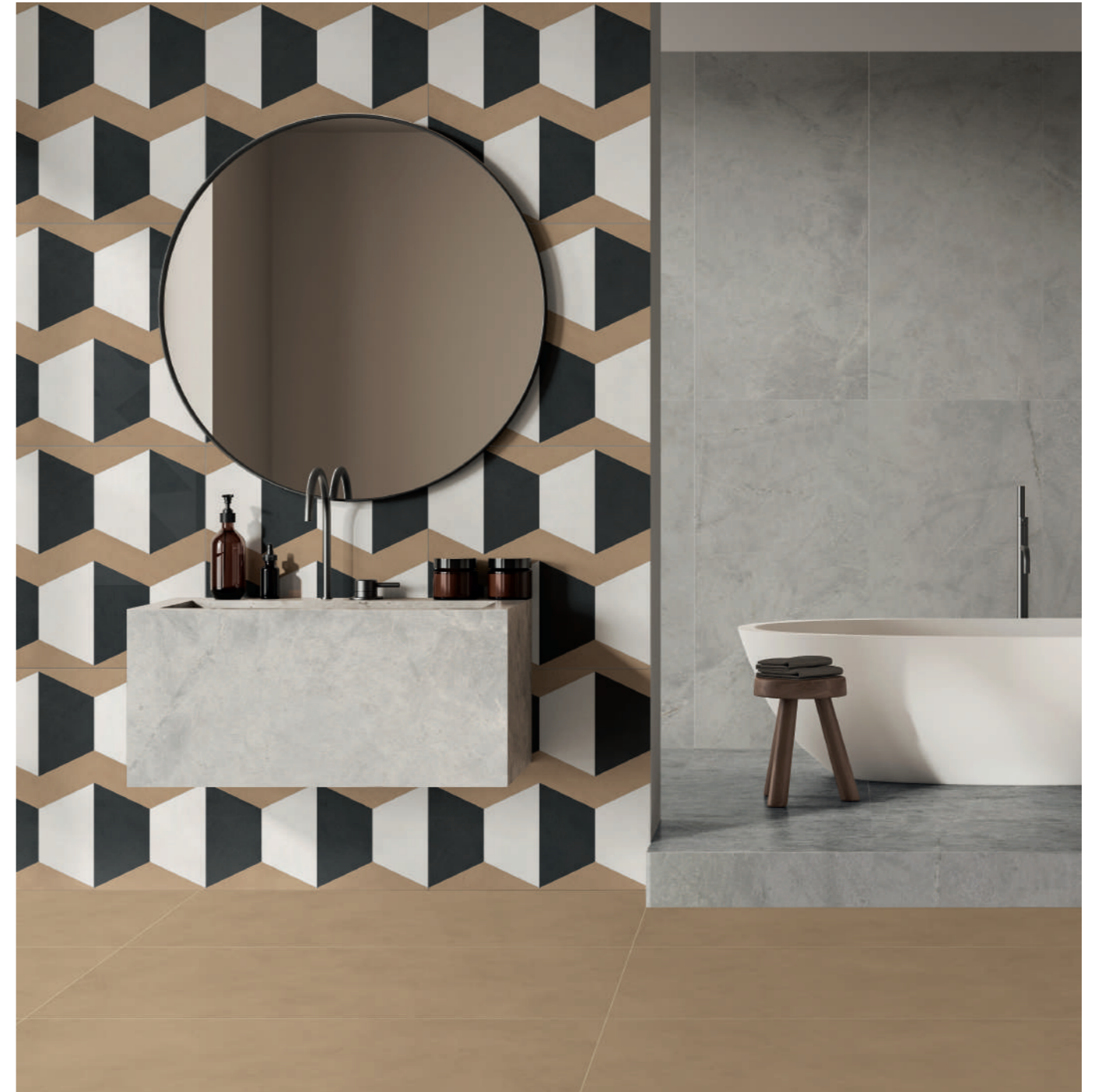
wall: 14ORAITALIANA HEXAGON 60x60 - ATLANTIS GREY 60x120 - floor: ALTEREGO MOU 60x120 - ATLANTIS GREY 60x120