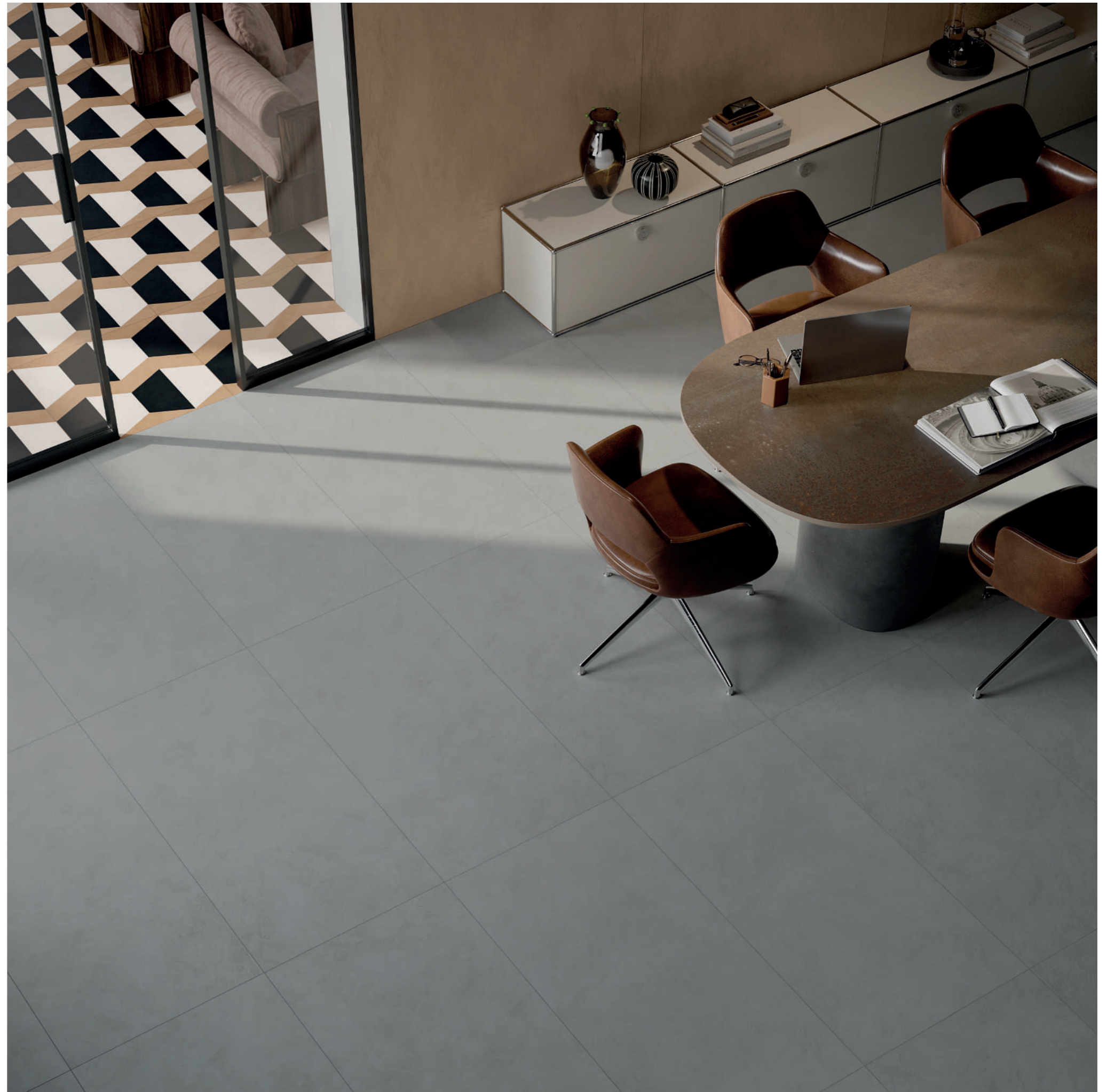
wall: ALTEREGO MOU 120x280 - table: ABKSTONE INTERNO 9 RUST 20mm