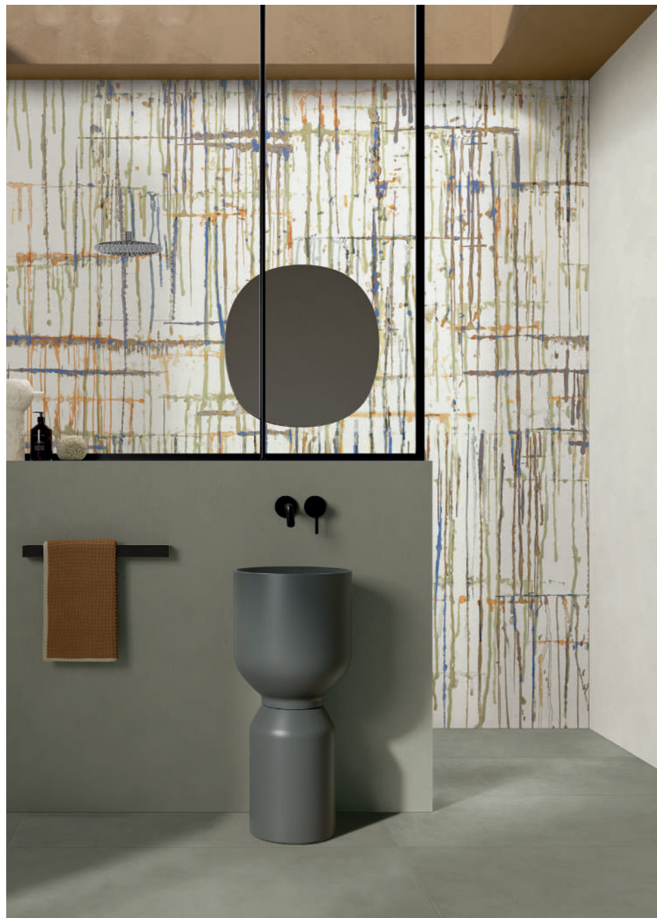
wall: ALTEREGO MILK 120x280 - MUD 60x120 - WIDE&STYLE DRIPPING LUX 120x280 floor: ALTEREGO MUD 60x120