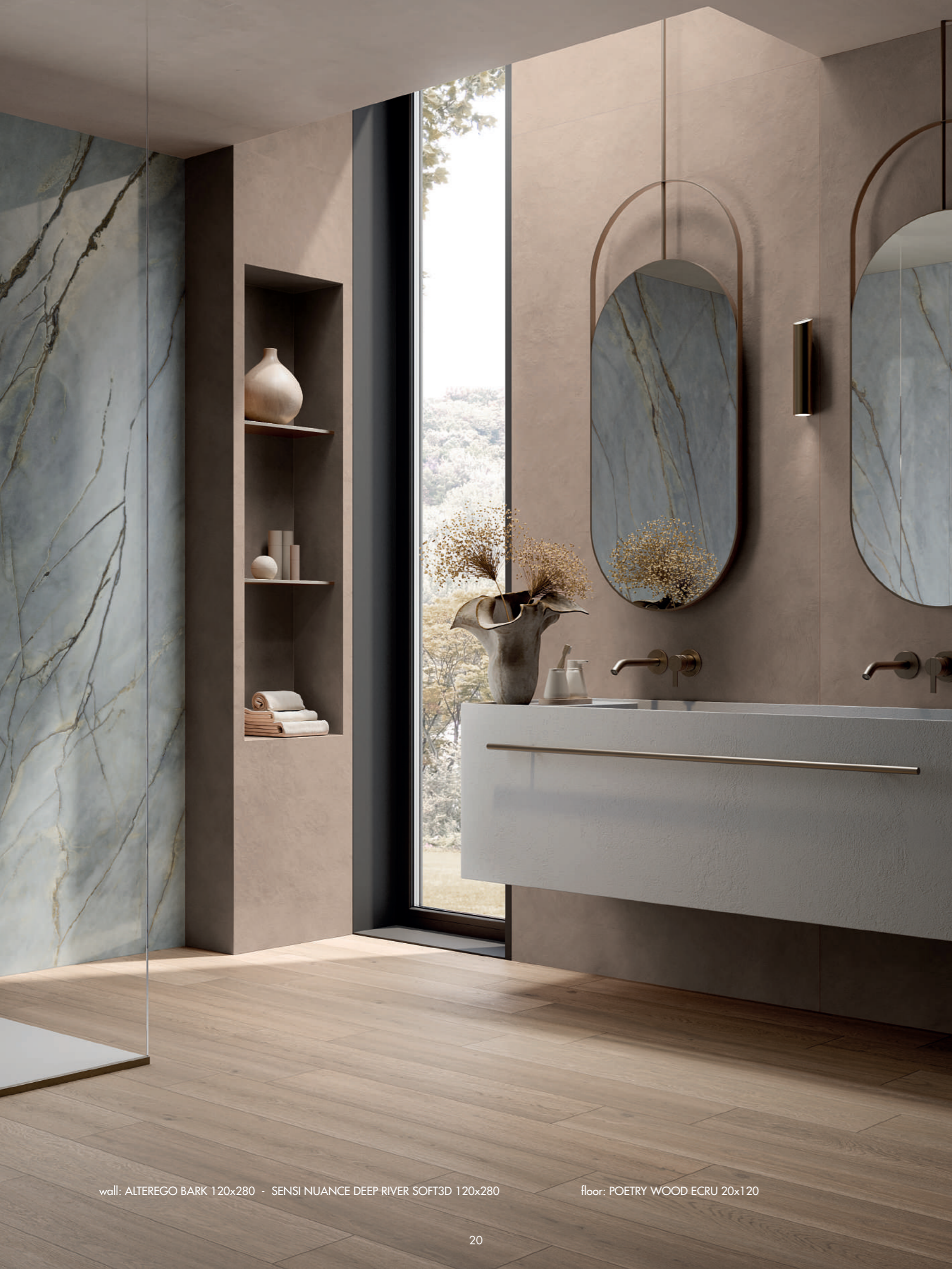
wall: ALTEREGO BARK 120x280 - SENSI NUANCE DEEP RIVER SOFT3D 120x280