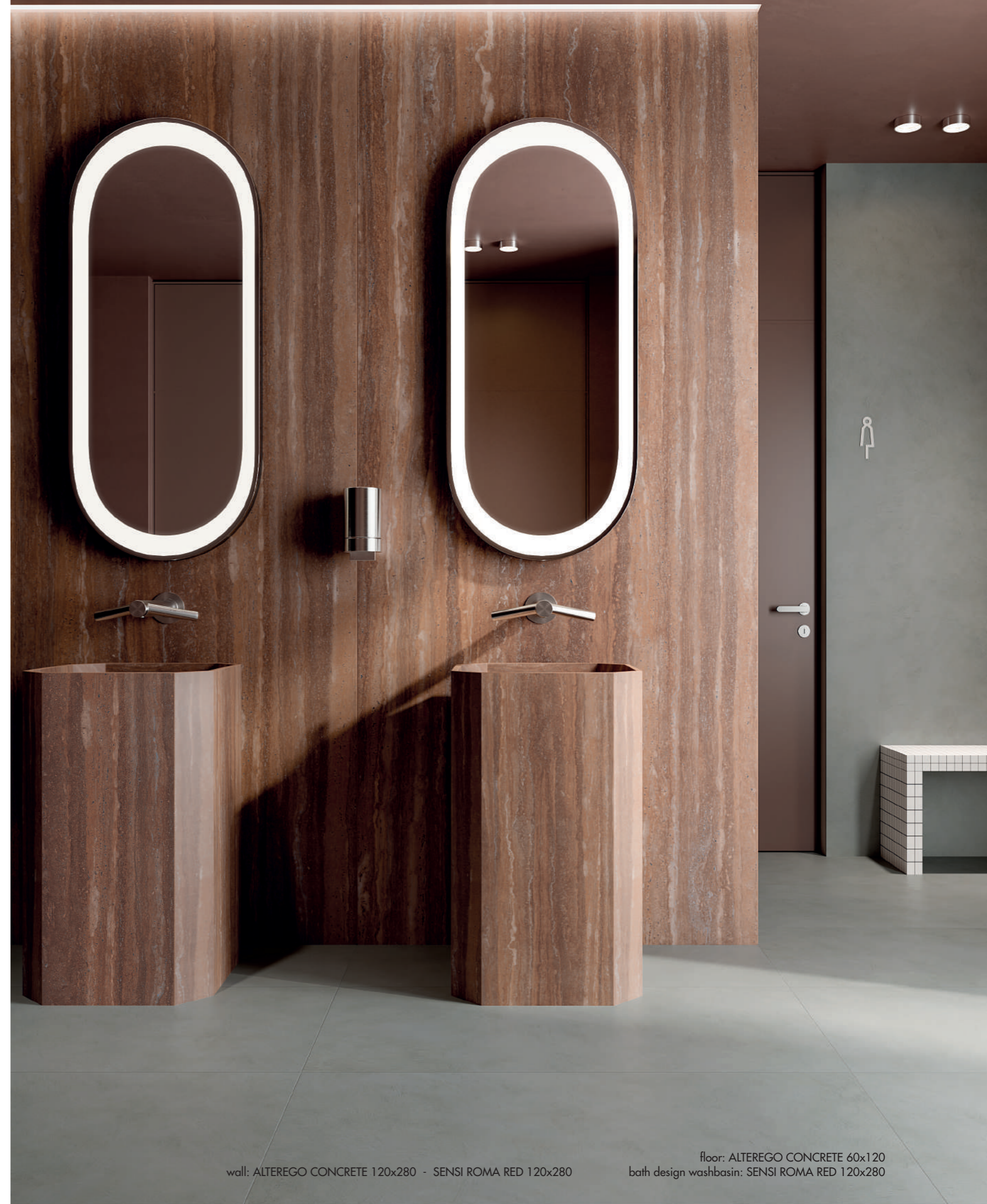
wall: ALTEREGO CONCRETE 120x280 - SENSI ROMA RED 120x280