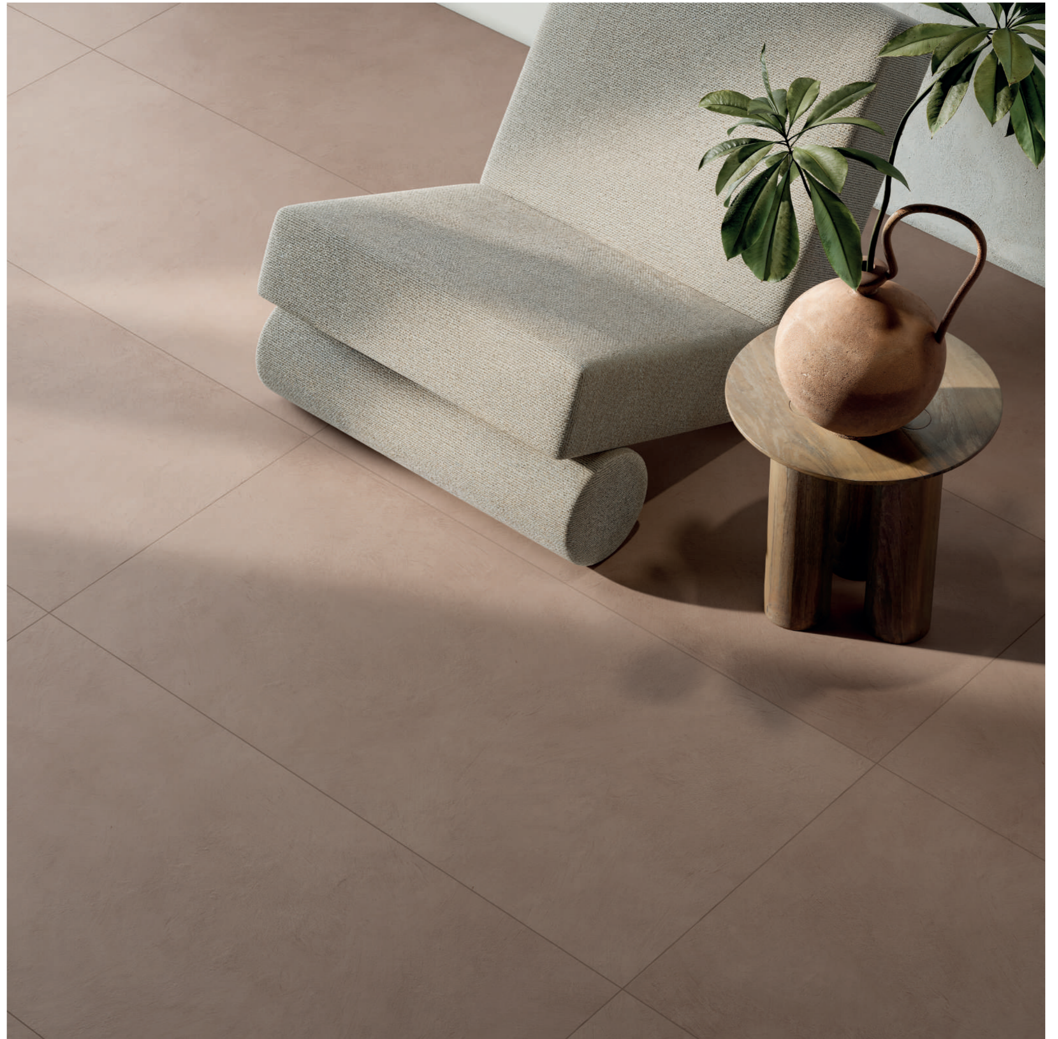
floor: ALTEREGO BARK 60x120