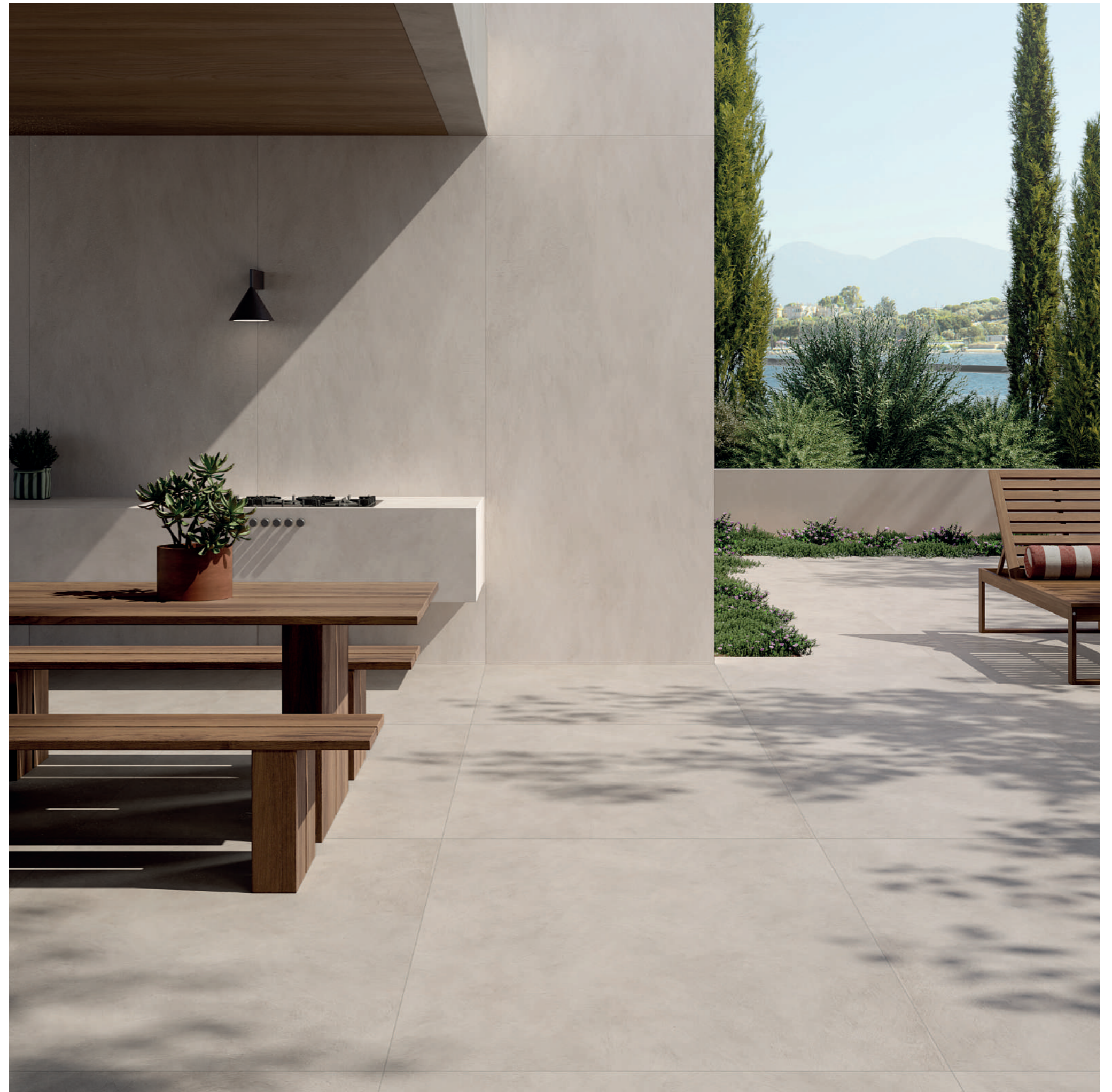
wall: ALTEREGO SAND 120x280