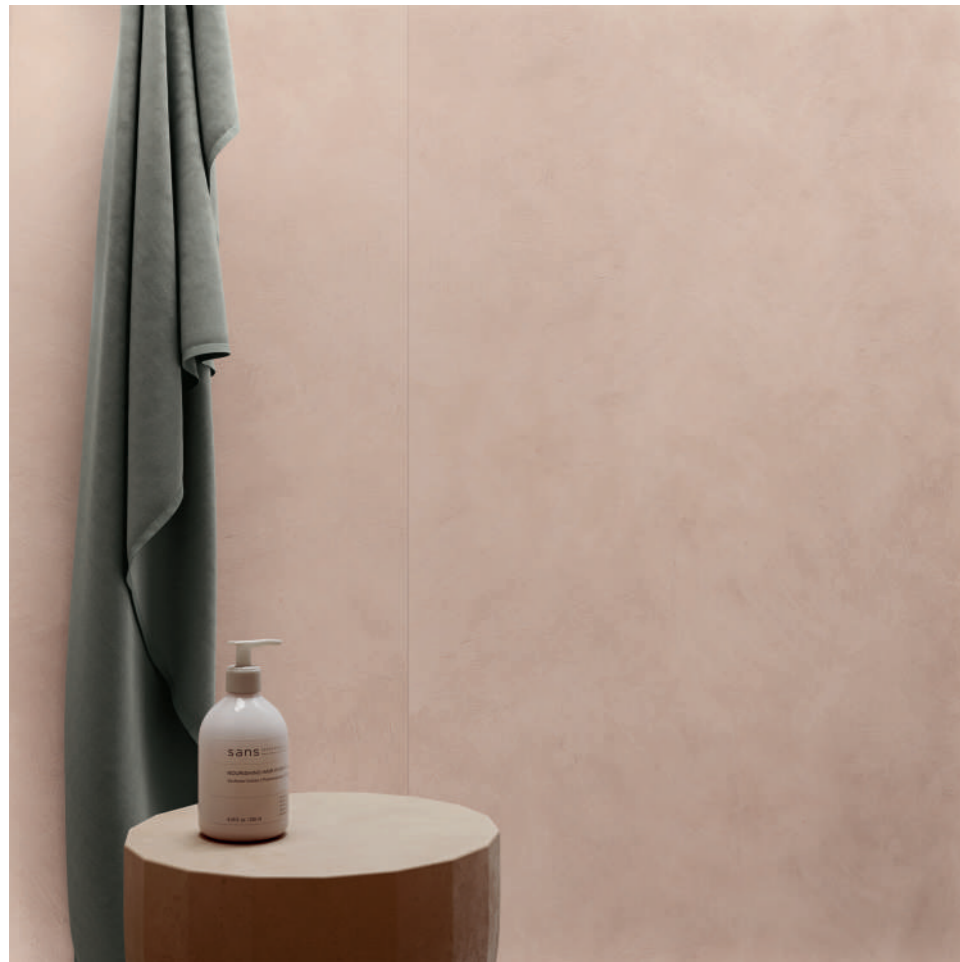
wall: ALTEREGO CLAY 120x280