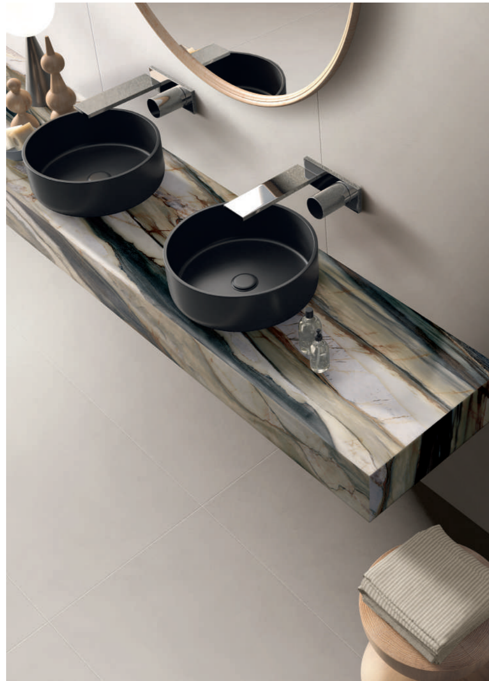
wall: ALTEREGO MILK 120x280 top: SENSI 900 OYSTER GOLD LUX 120x280