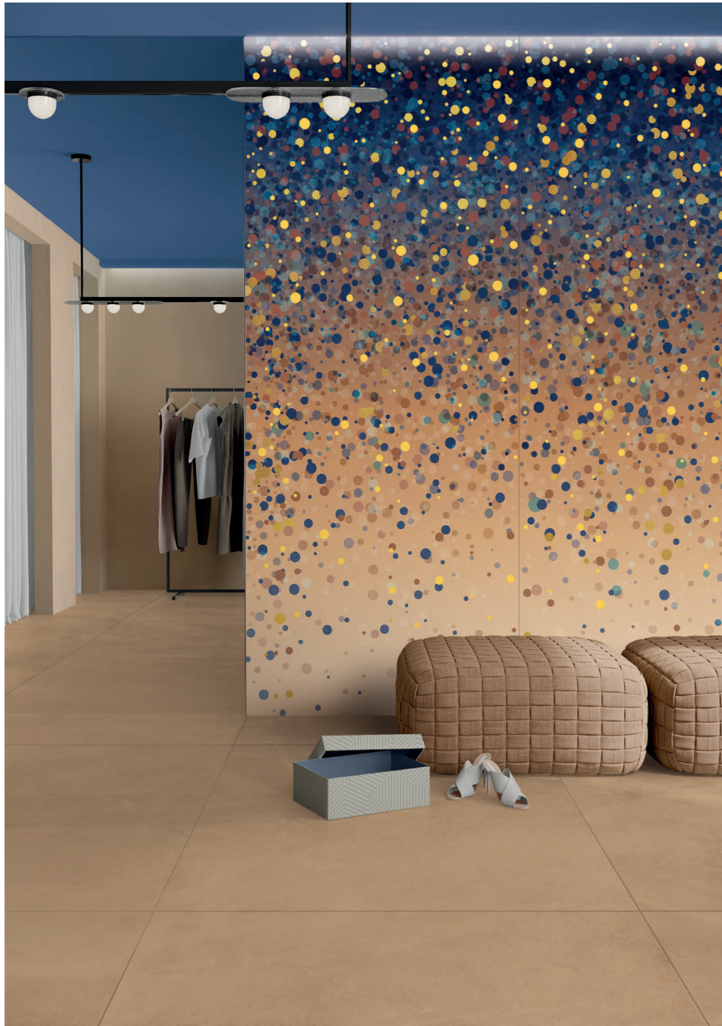
wall: WIDE&STYLE CONFETTI BLUE 120x280