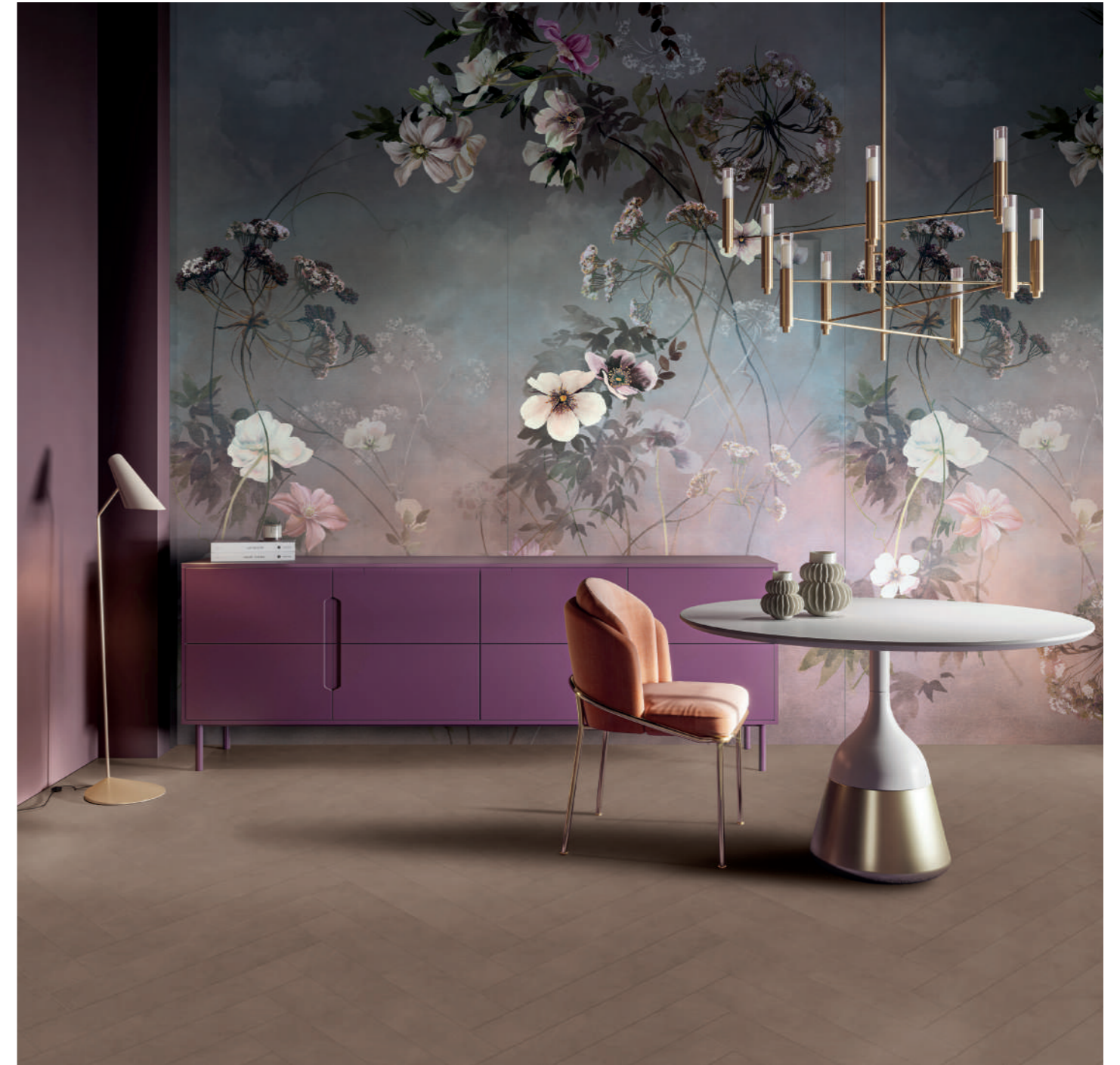
wall: WIDE&STYLE COUNTRY FLOWERS PINK 120x280