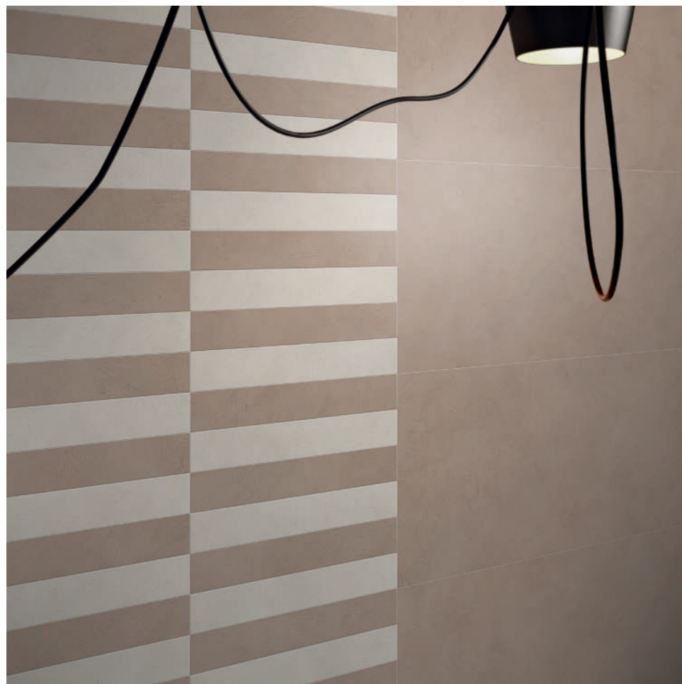
wall: ALTEREGO BARK 60x120 - 10x60 - SAND 10x60