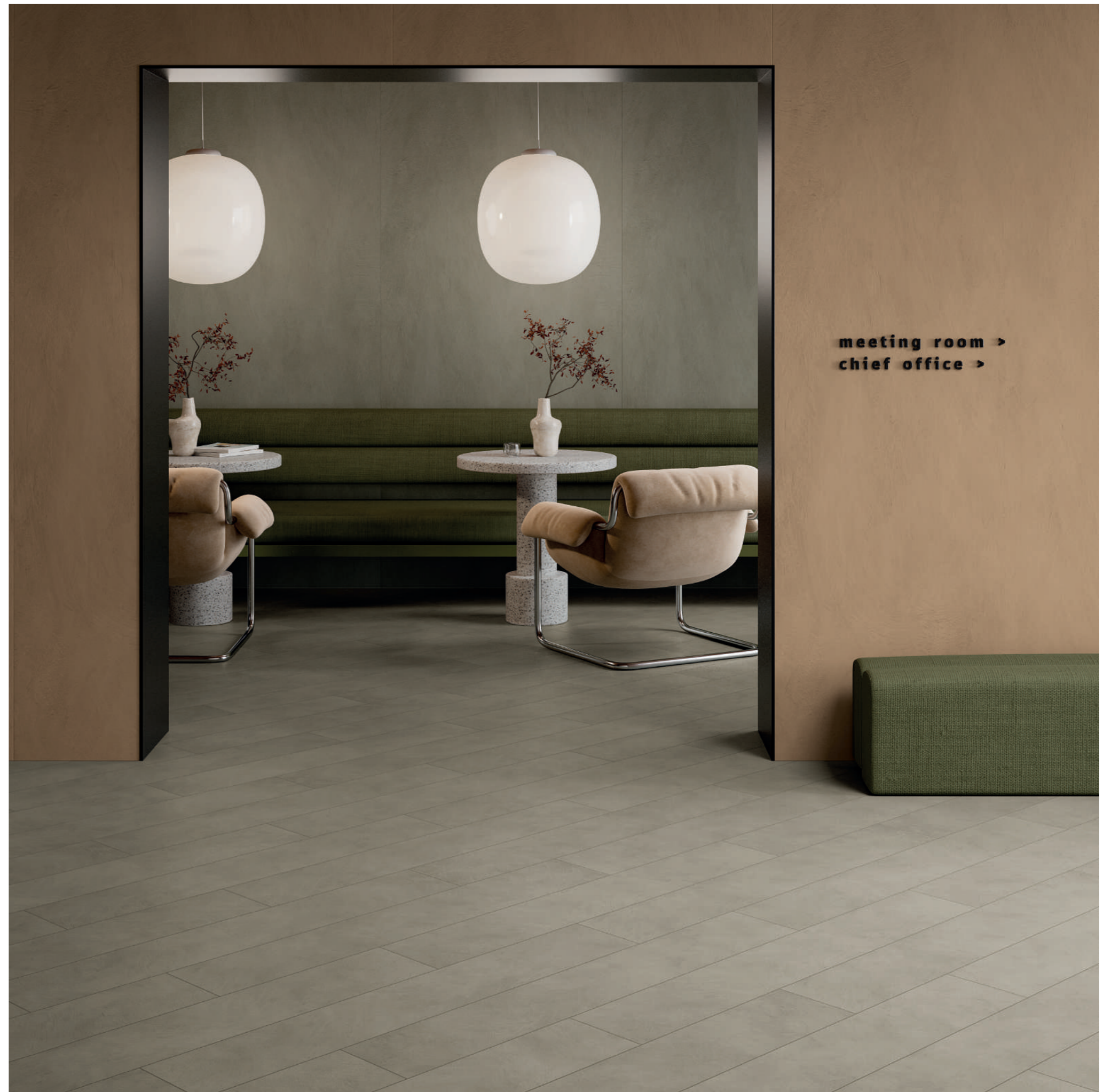
wall: ALTEREGO MUD 120x280 - MOU 120x280