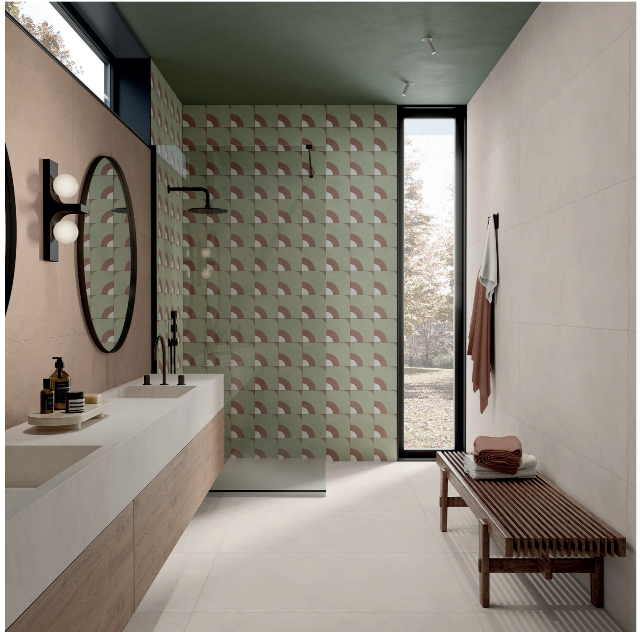
washbasin: ALTEREGO MILK 120x280