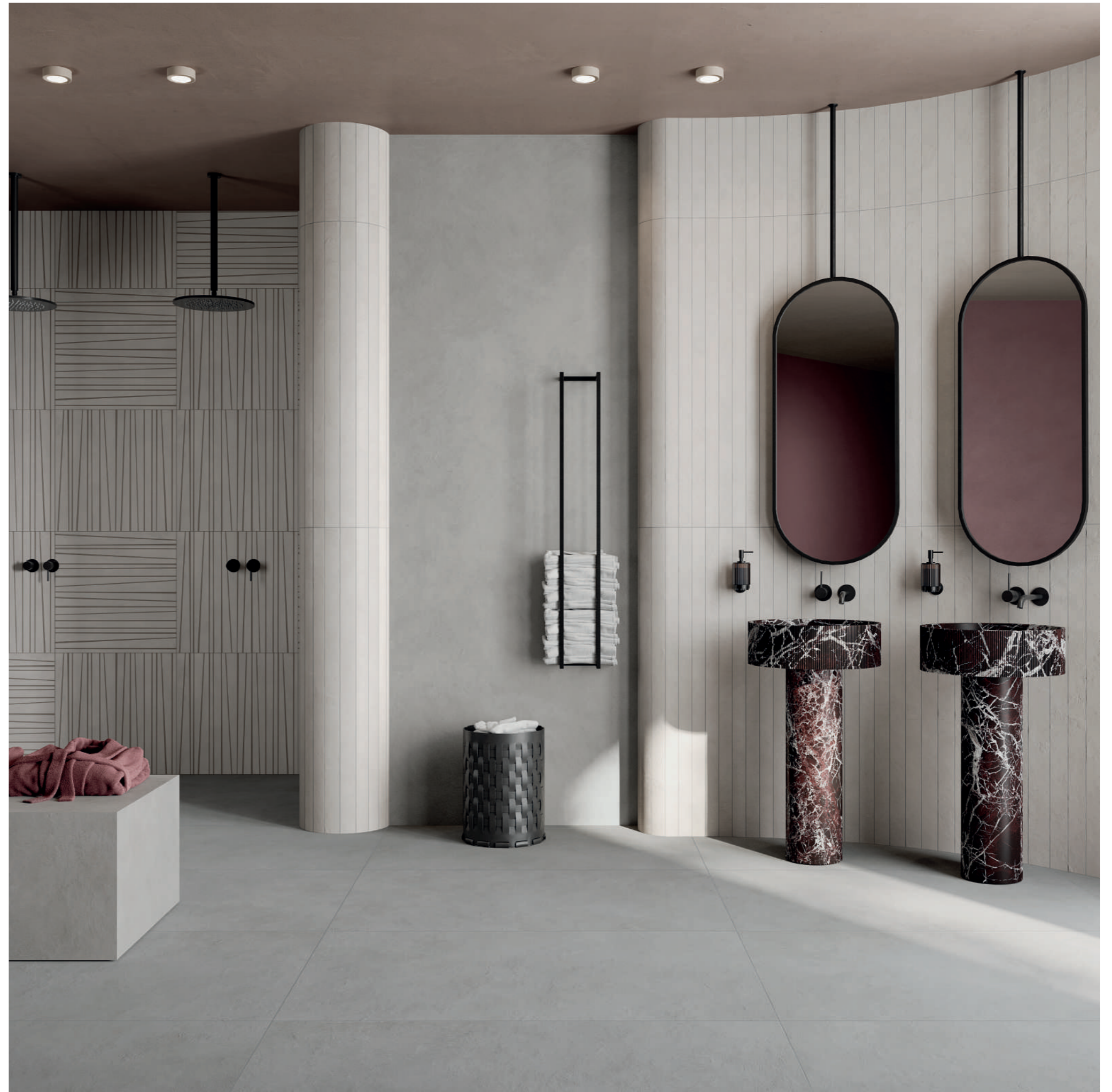
wall: ALTEREGO ASH 120x280 - MILK 5x120 - 14ORAITALIANA STICKS MILK 60x60 floor: ALTEREGO ASH R11 60x120