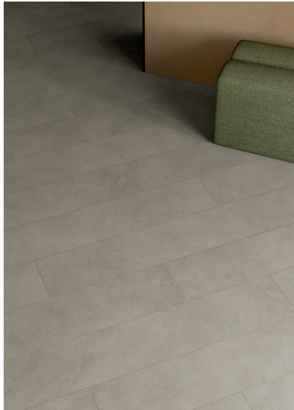
floor: ALTEREGO MUD 20x120