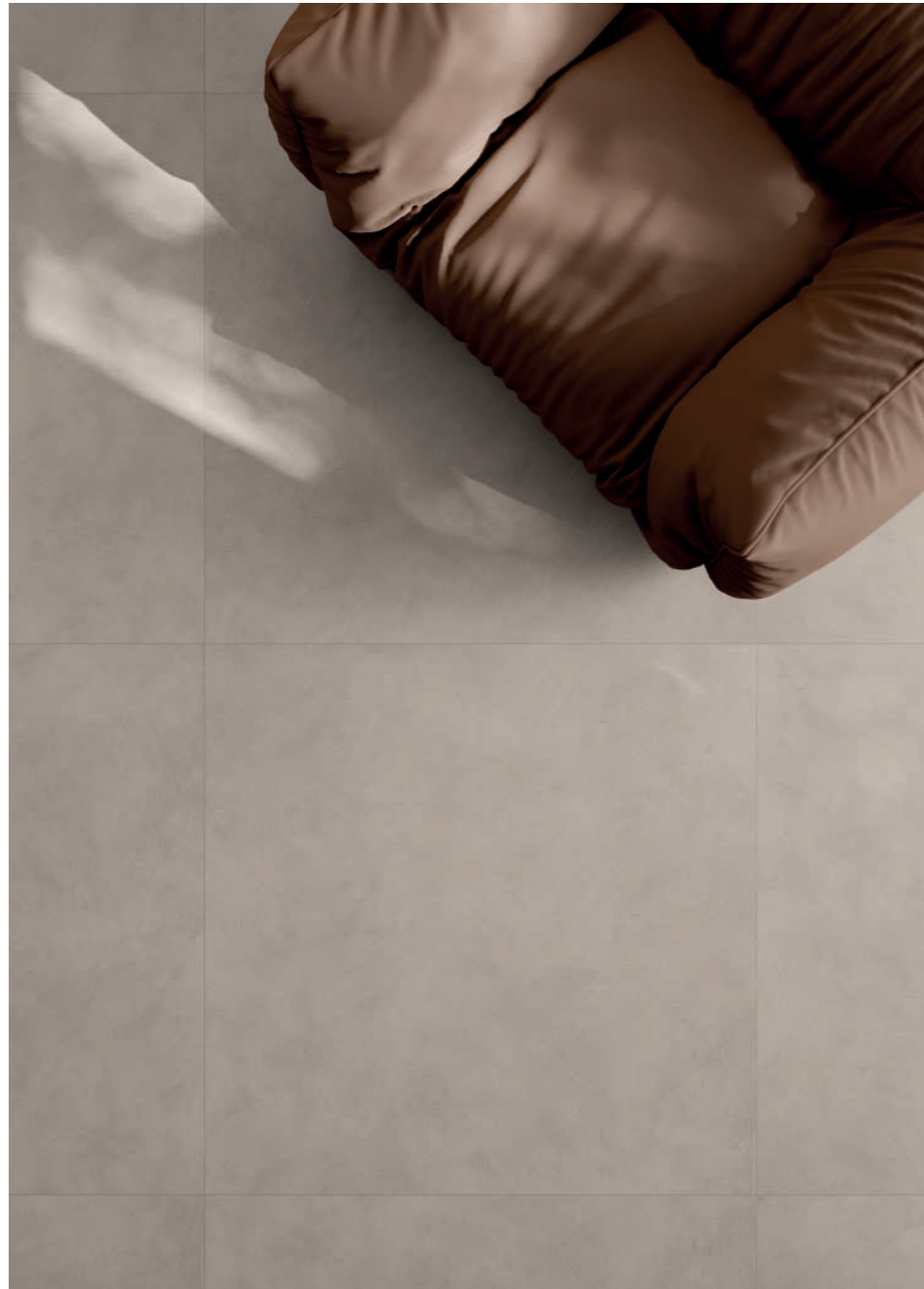
floor: ALTEREGO SAND 120x120