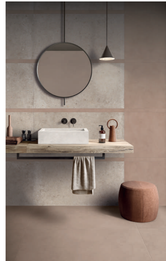
RESIN + STONE