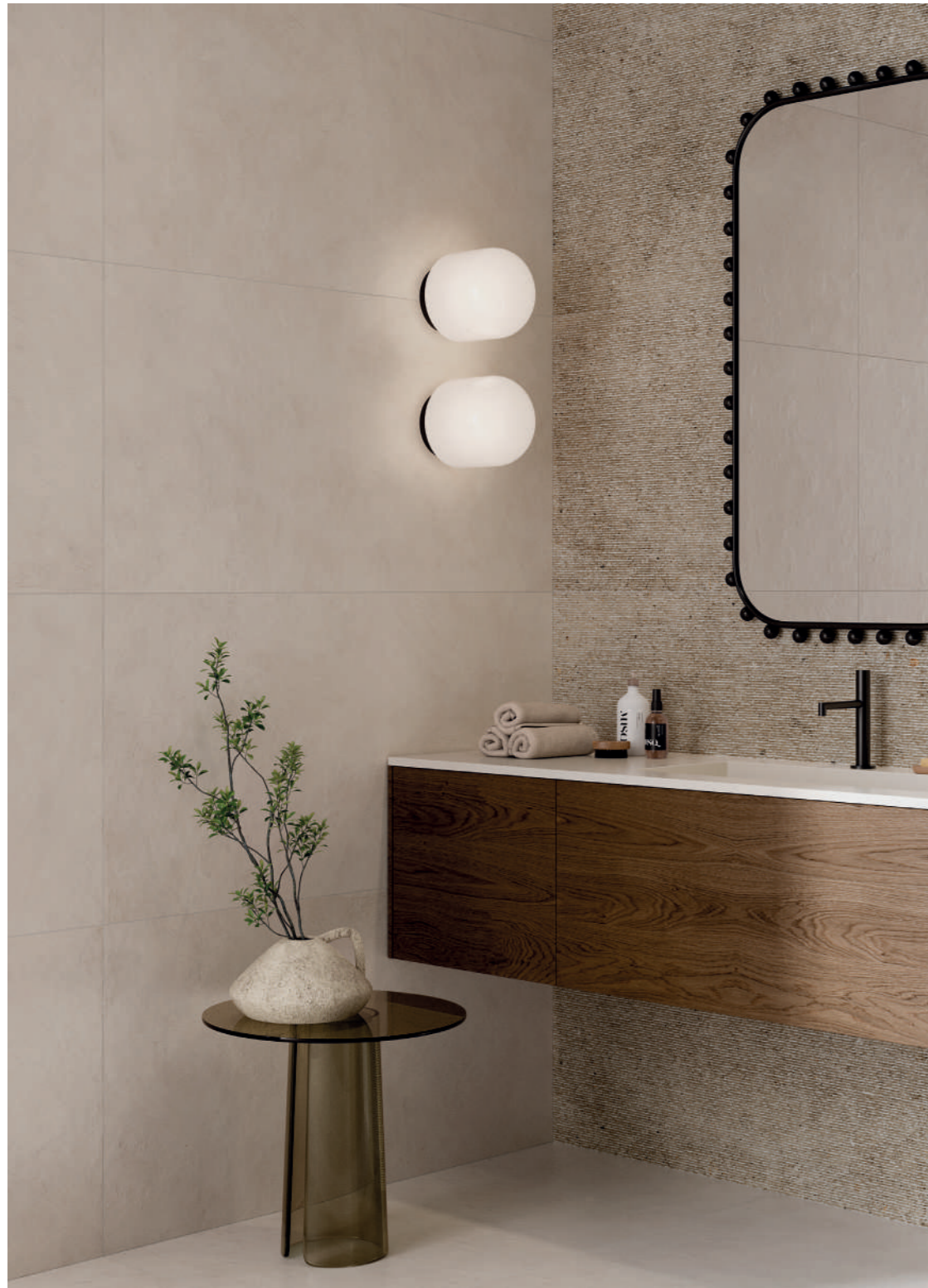
wall: ALTEREGO SAND 60x120 - POETRY STONE CARVING ECRU 60x120