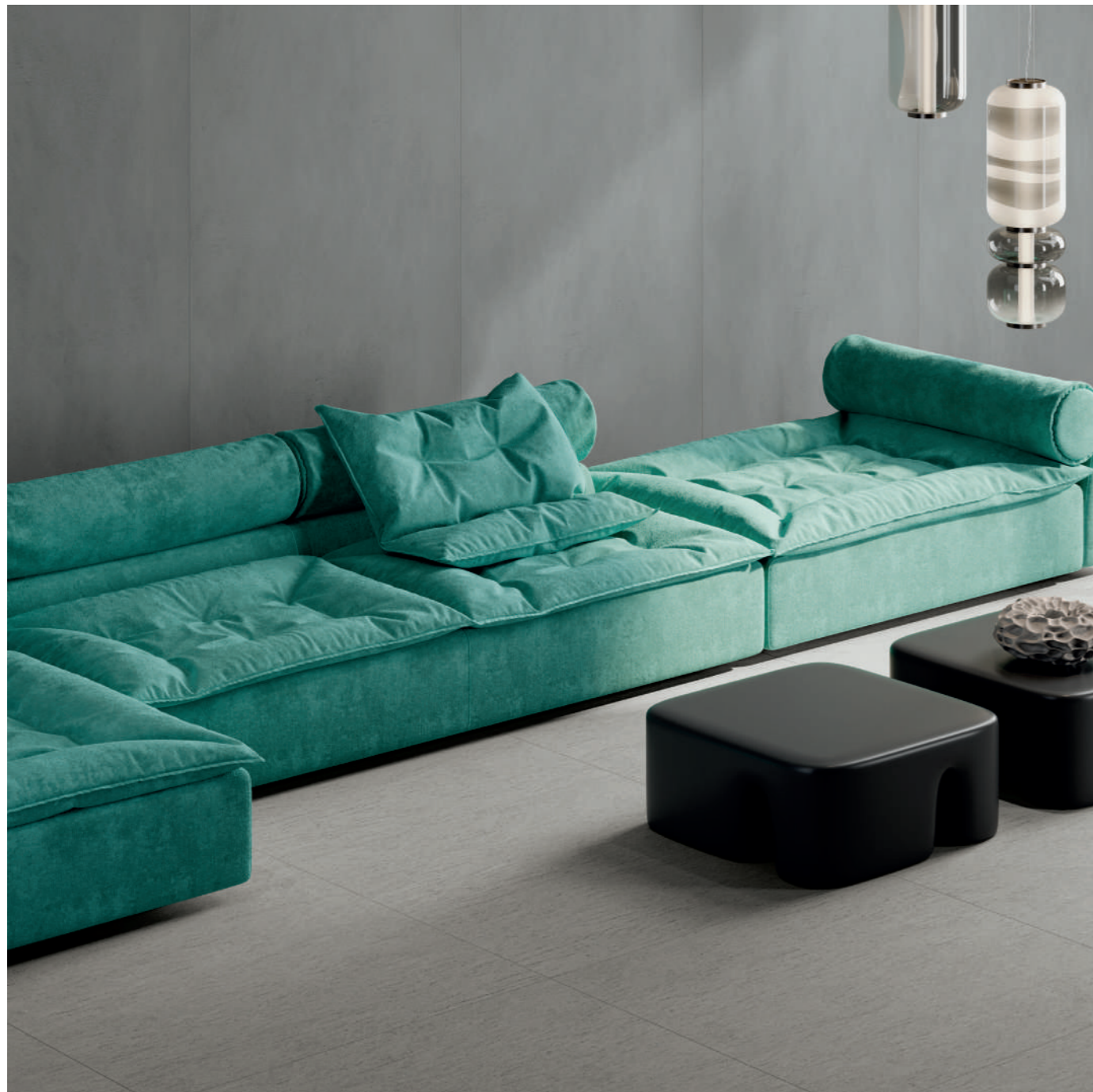
wall: ALTEREGO CONCRETE 120x280