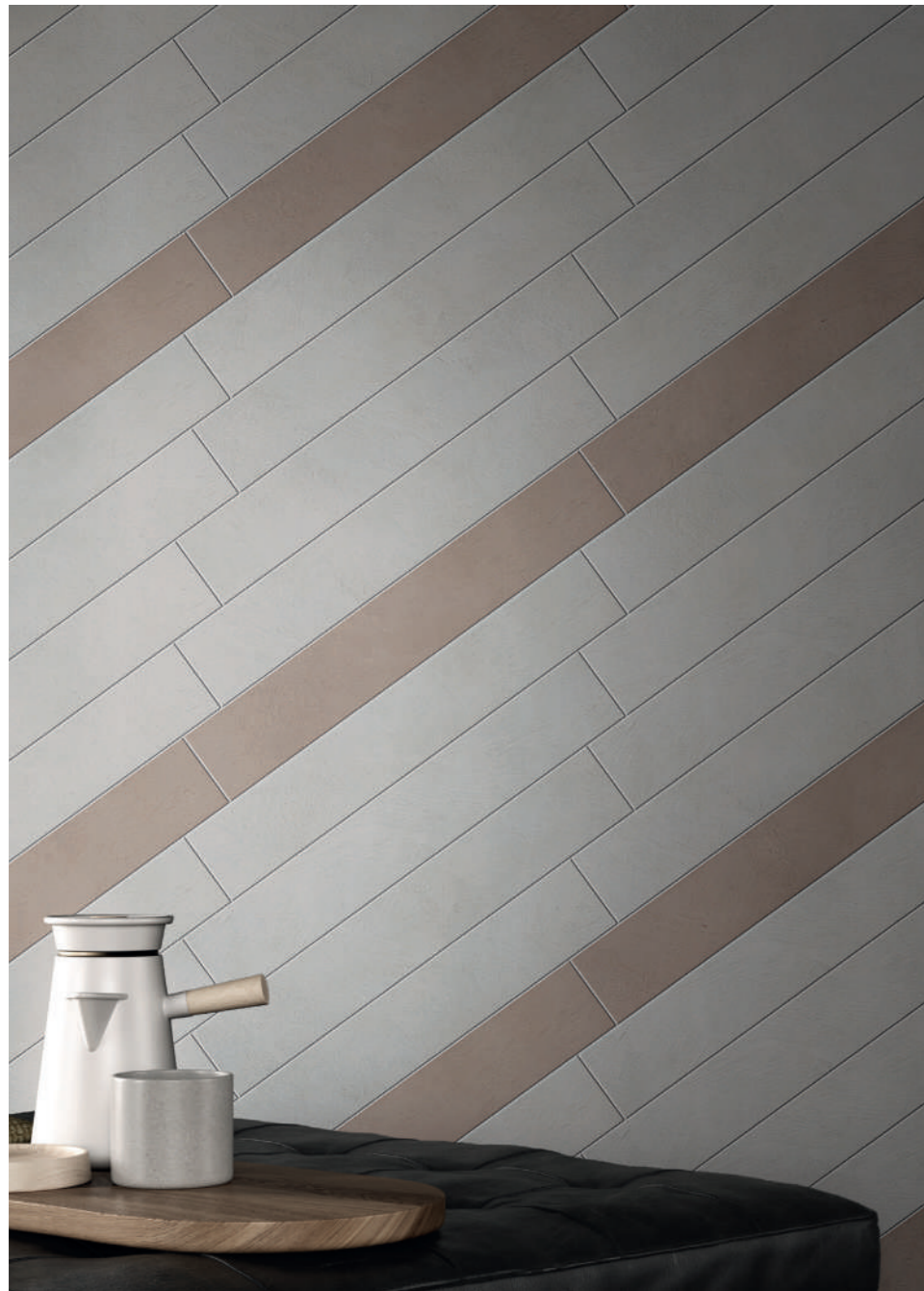
wall: ALTEREGO ASH 10x60 - BARK 10x60