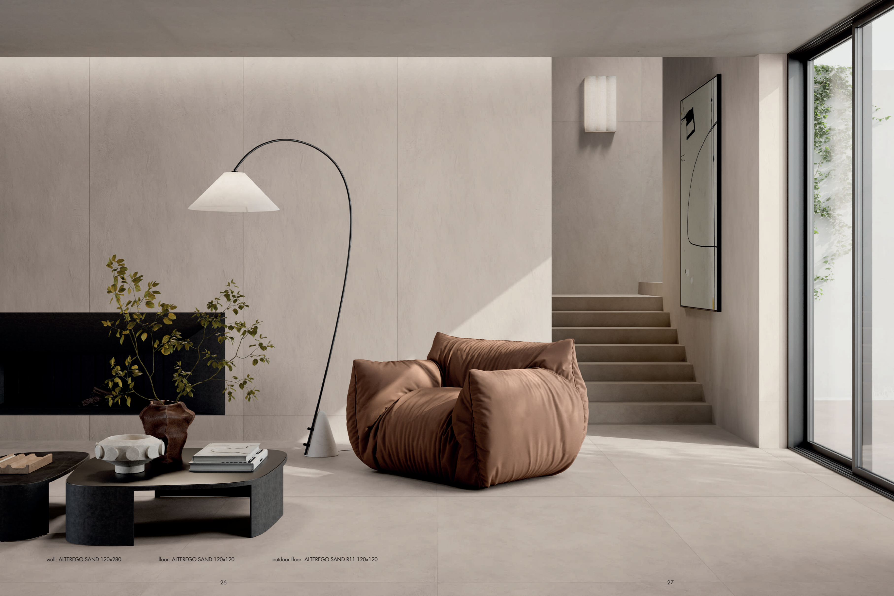
wall: ALTEREGO SAND 120x280