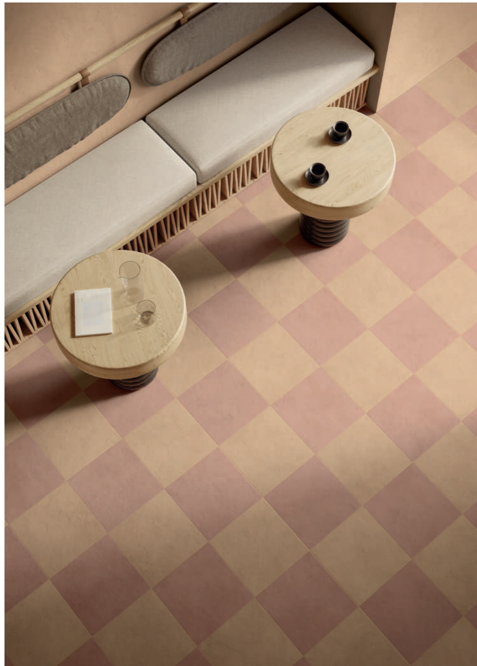
wall: ALTEREGO MOU 120x280