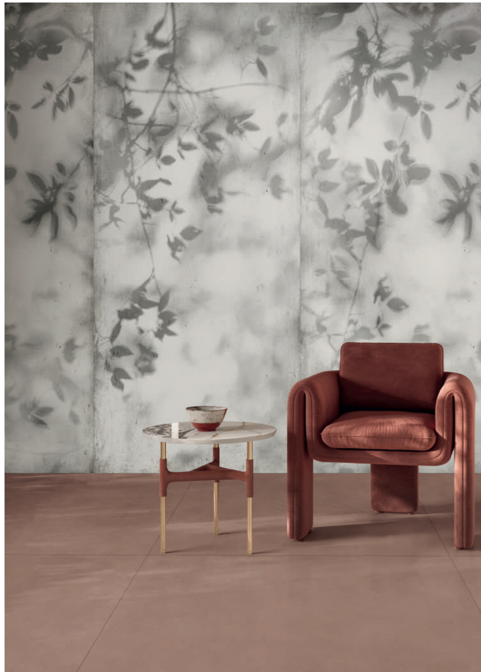
wall: WIDE&STYLE SHADOW 120x280