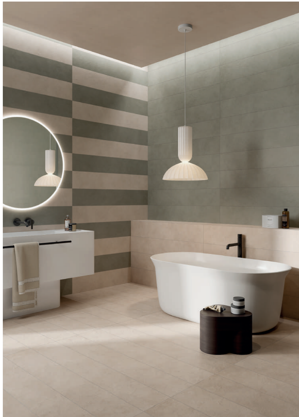
wall: ALTEREGO CREAM 20x120 - MUD 20x120