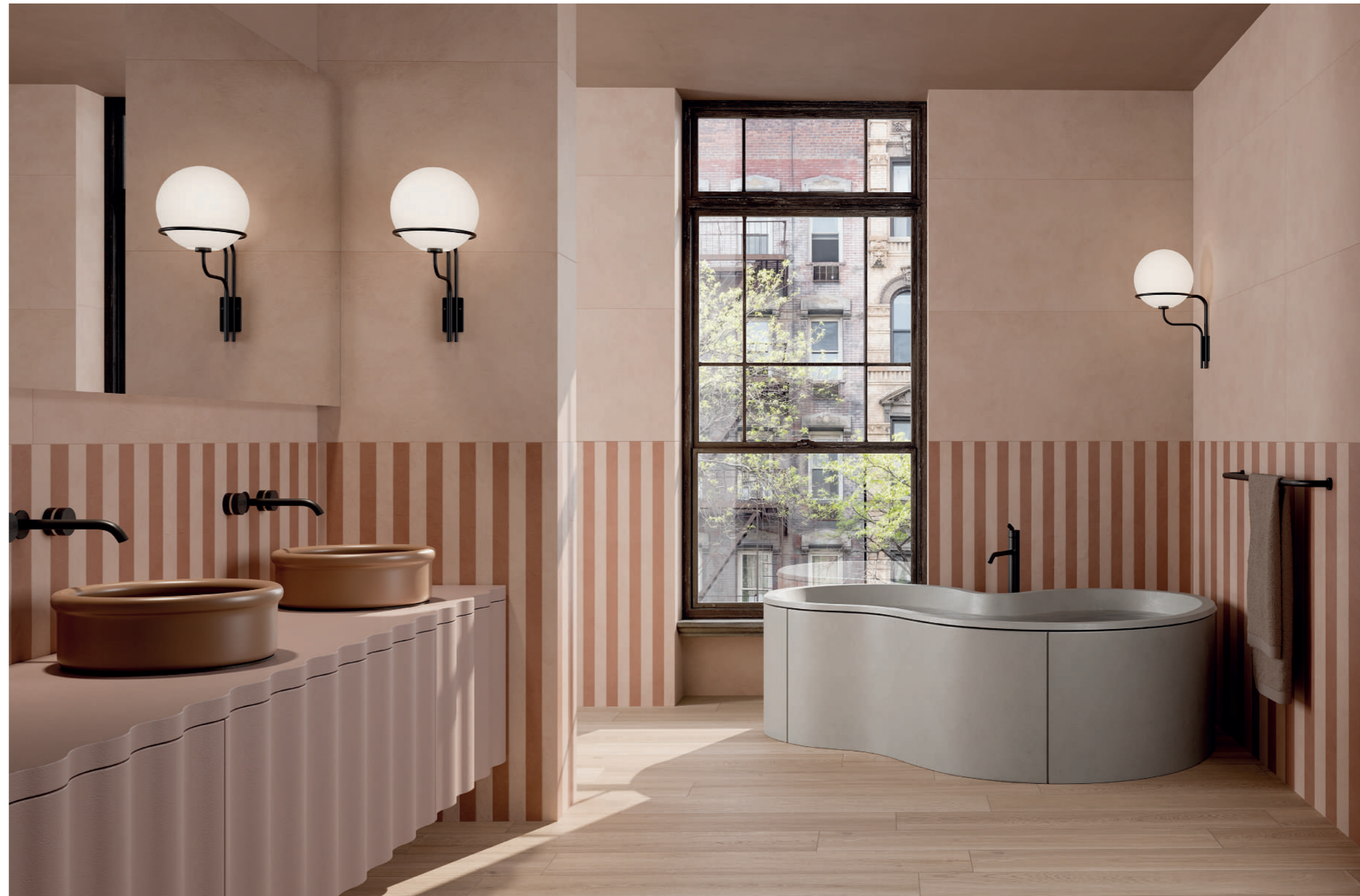
wall: ALTEREGO CLAY 60x120 - 5x120 - COTTO 5x120