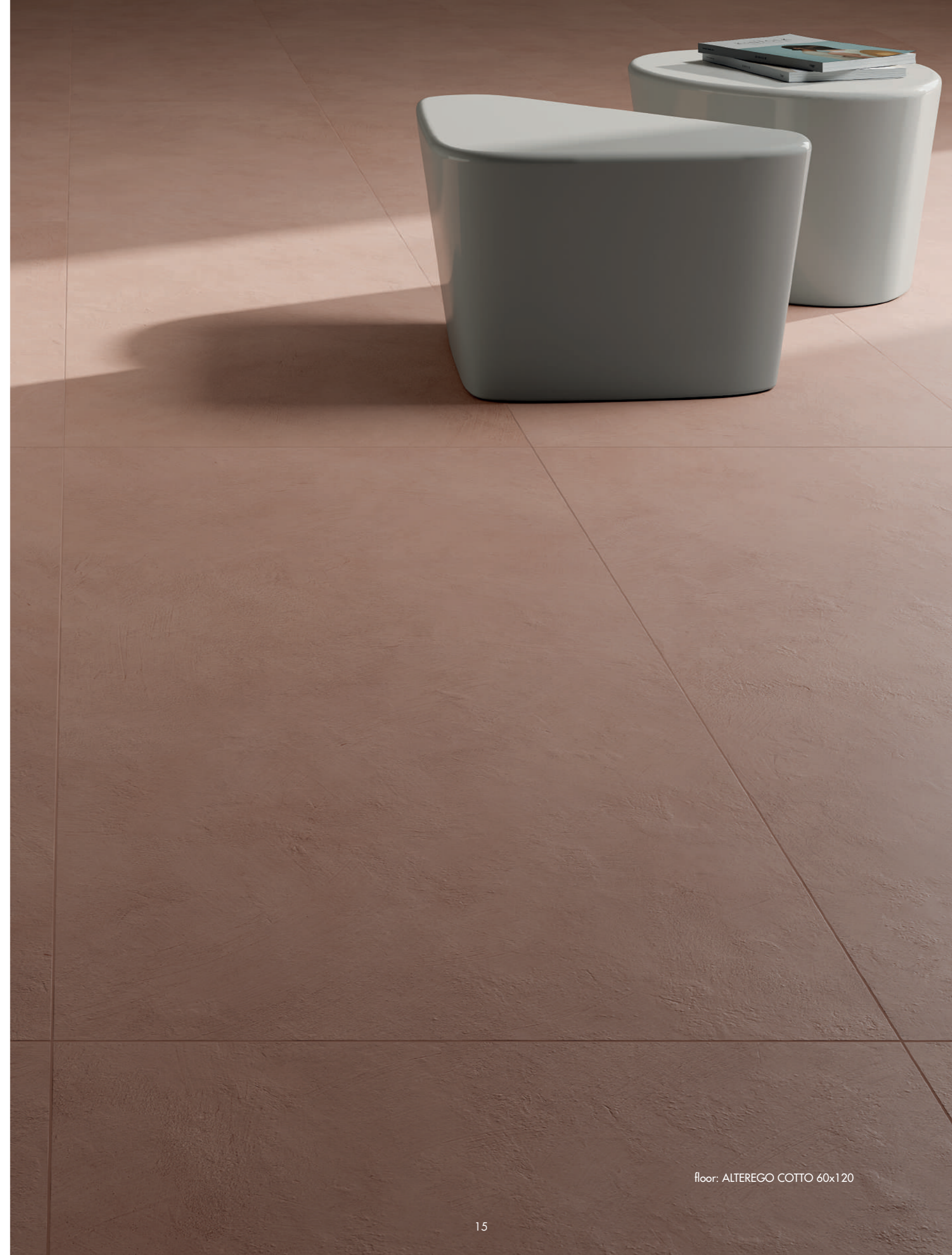
floor: ALTEREGO COTTO 60x120